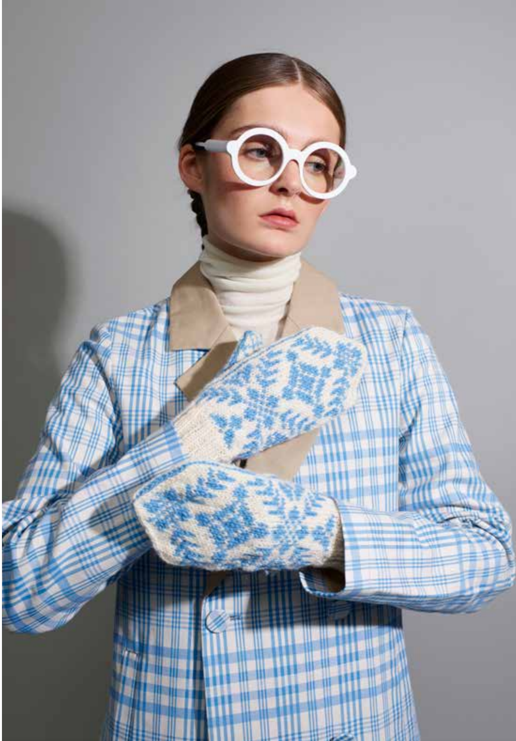
320-1 Votter i 3-tråds til dame, herre og barn 3-14 år