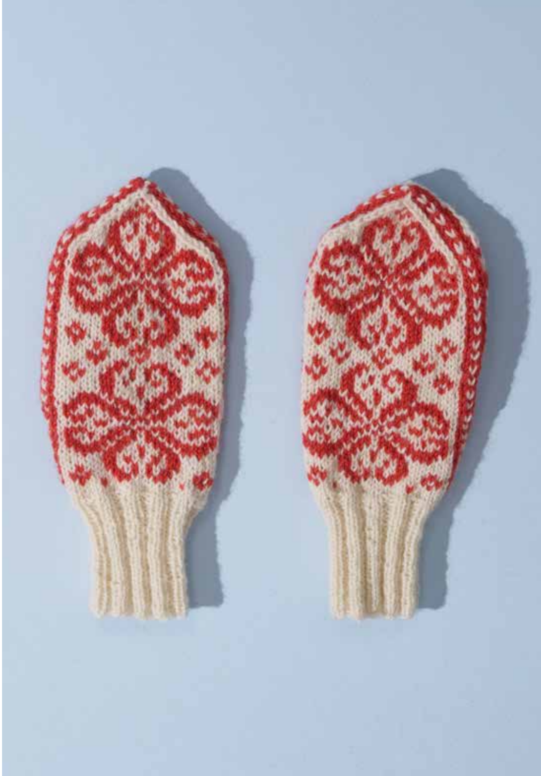
320-3 Votter i 3-tråds til dame, herre og barn 3-14 år