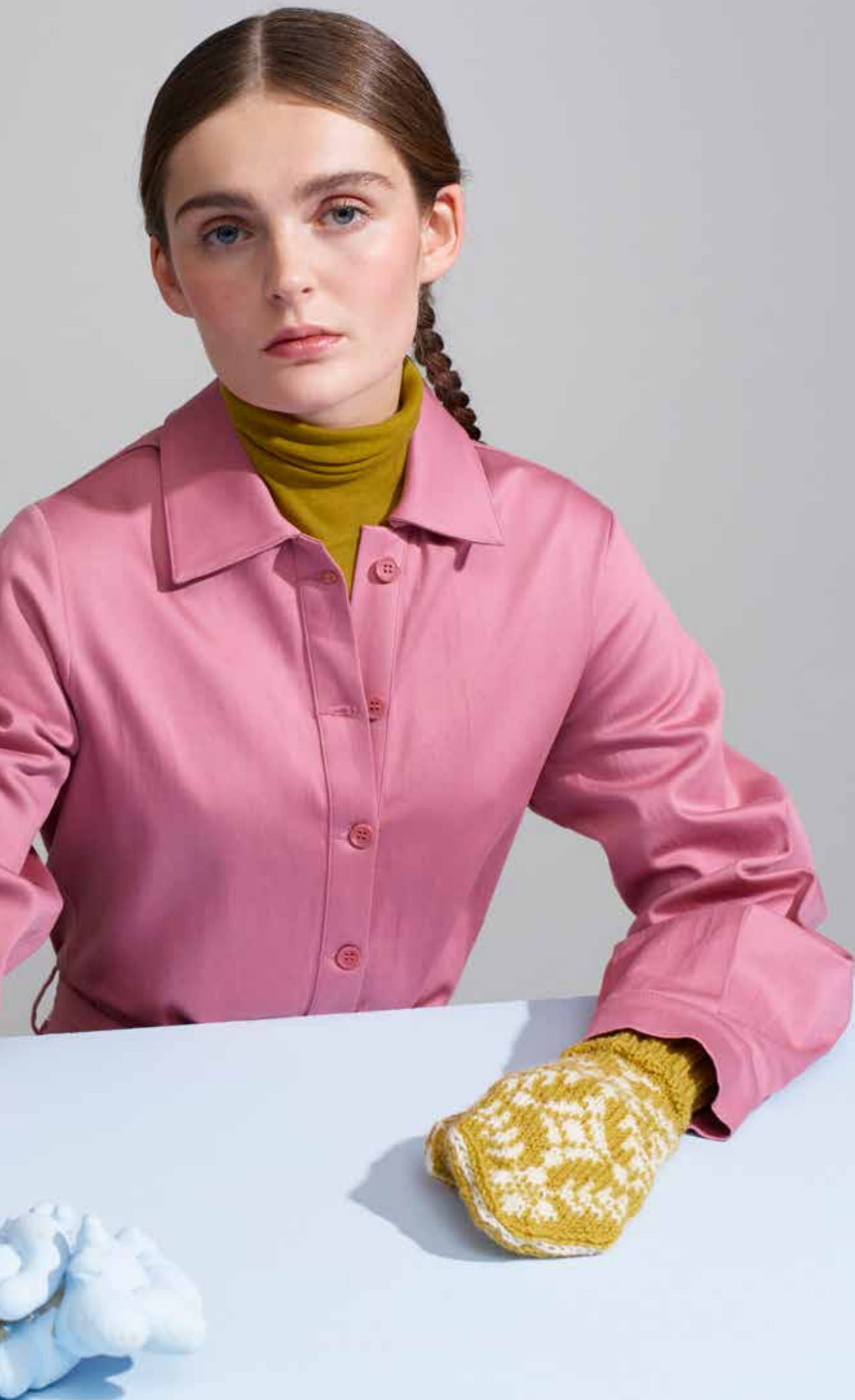
320-1 Votter i 3-tråds til dame, herre og barn 3-14 år