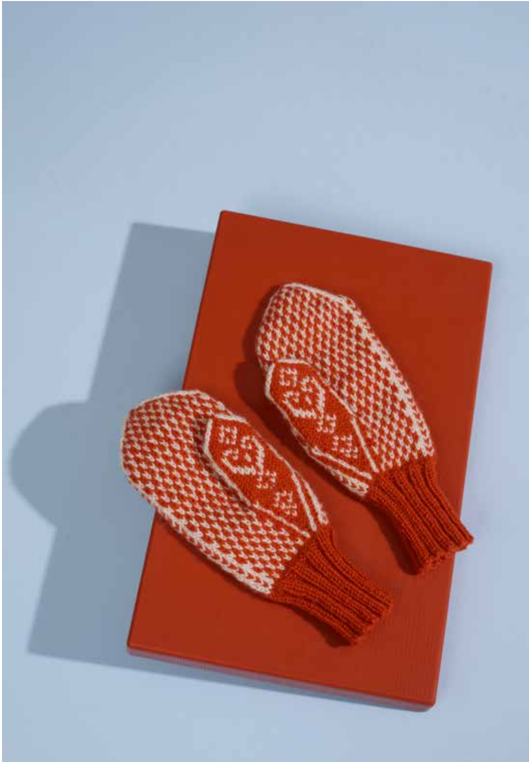
320-3 Votter i 3-tråds til dame, herre og barn 3-14 år