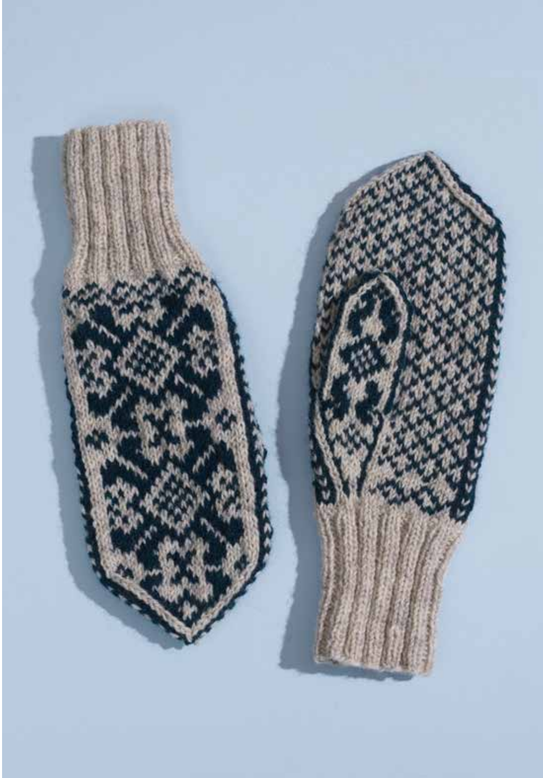
320-5 Votter i 3-tråds til dame, herre og barn 3-14 år