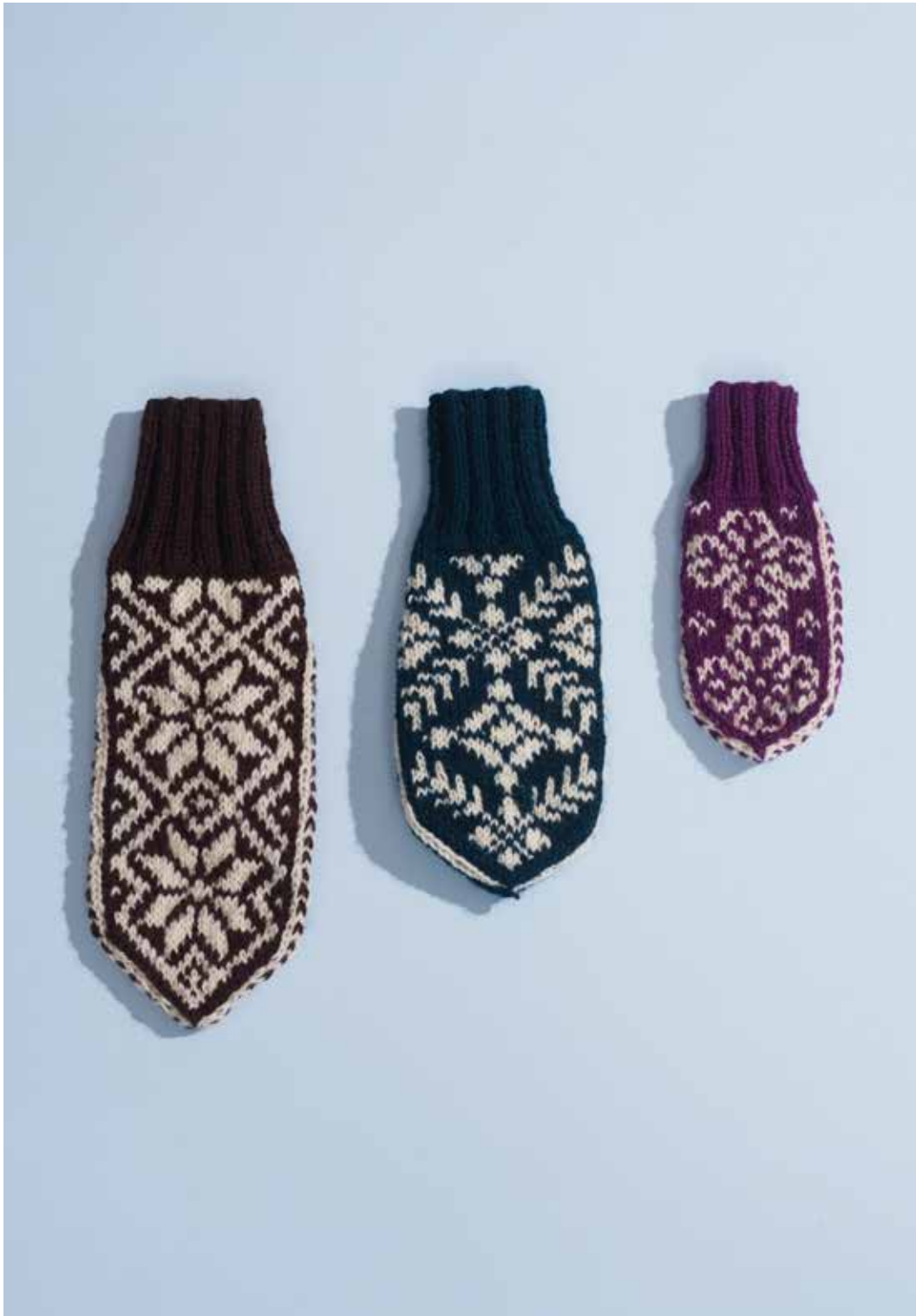
320-4 Votter i 3-tråds 320-1 Votter i 3-tråds 320-3 Votter i 3-tråds