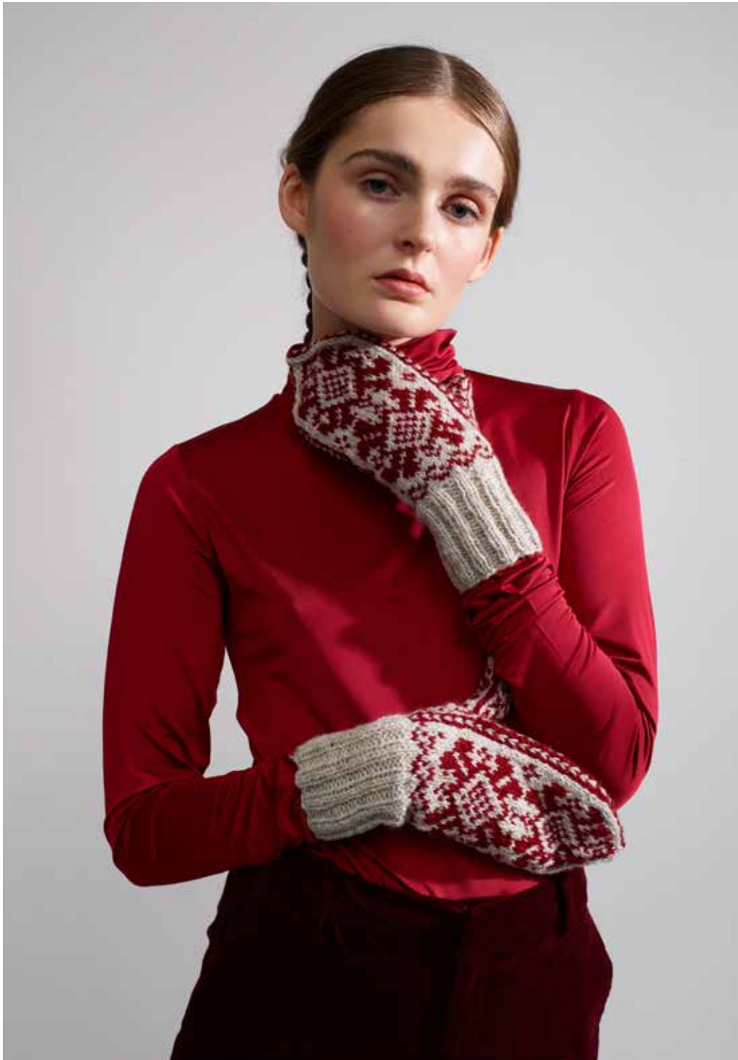
320-5 Votter i 3-tråds til dame, herre og barn 3-14 år