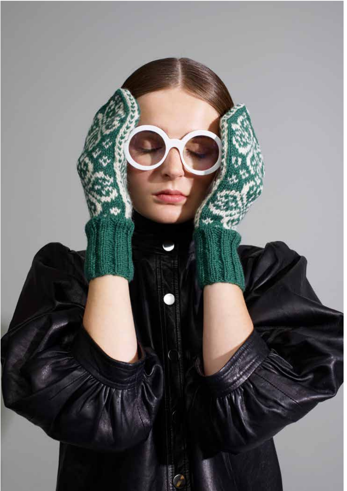
320-3 Votter i 3-tråds til dame, herre og barn 3-14 år